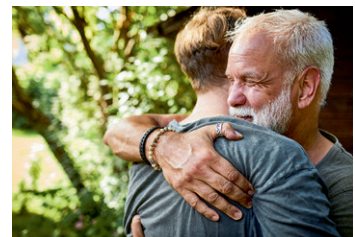
Bild 1: © Oliver Rossi/Digital Vision/Getty Images. Bild 2: © Peopleimages/E+/Getty Images. Bild 3: © Oliver Rossi/Digital Vision/Getty Images.