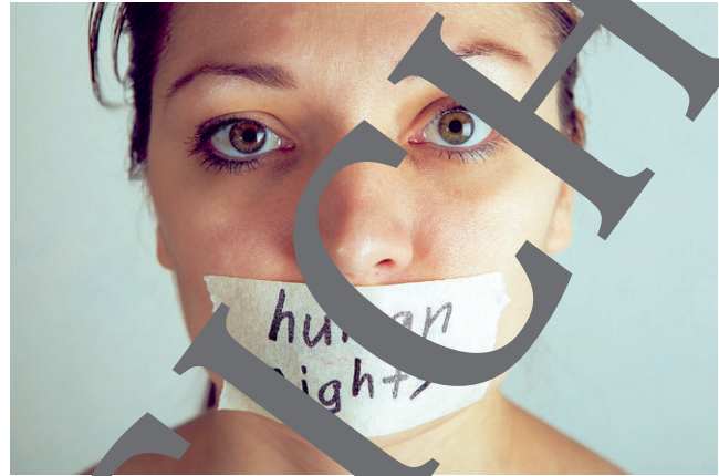
Menschenrechte gelten noch immer nicht überall!

Was sind Menschenrechte? Wer definiert sie? Und wie kann man sich für ihre Einhaltung einsetzen? In dieser Einheit erfahren die Jugendlichen, was jeder Einzelne für den Schutz der Menschenrechte im Alltag tun kann.