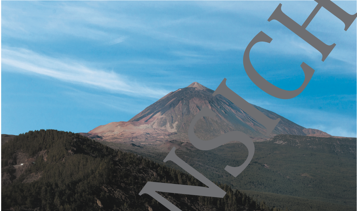
Blick auf den Pico del Teide

Der Pico del Teide (3718 m) ist der höchste Berg auf Teneriffa. Touristen, die nach Teneriffa kommen, können beobachten, wie sich täglich das Wetter am Berg ändert. Morgens ist der Himmel strahlend blau, keine Wolke ist zu sehen. Tagsüber bilden sich Wolken, die immer dichter werden. Gegen Abend kann es auch schon einmal regnen. Warum ist das so?