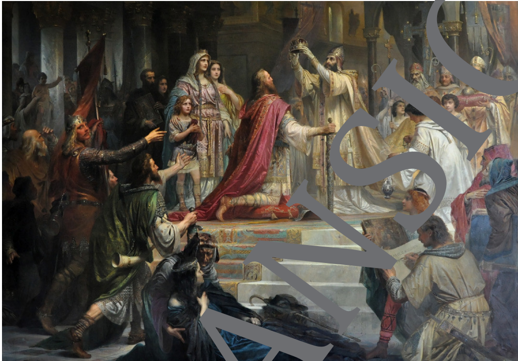
Friedrich Kaulbach/Public domain

Kaiser und Papst – zwei der bedeutsamsten Instanzen für die Weltordnung im europäischen Mittelalter. Zwei Instanzen, die immer wieder miteinander in Konflikt gerieten und damit das Leben der Menschen ihrer Zeit nicht unwesentlich beeinflussten. Die Auseinandersetzung mit der Frage der Machtverteilung ist ein wesentlicher Bestandteil des Grundverständnisses von Herrschaftsstrukturen im Mittelalter und wird mithilfe von digitalen Apps und Programmen und im Rahmen von ansprechenden Sichtserzählungen eingeführt.