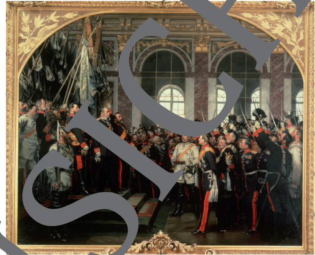
Am 18. Januar 1871 wird im Spiegelsaal von Versailles aus einem deutschen Fürsten der Kaiser des Deutschen Reiches.

Zahlreiche Gegenwartsbezüge sollen den Schülerinnen und Schülern helfen, die Bedeutung der Reichsgründung von 1871 einzuschätzen. Gearbeitet wird mit vielfältigen Methoden und Medien: Fotos, Gemälden, Schaubildern, Karten und Texten. Ein Rollenspiel rundet die Einheit ab.