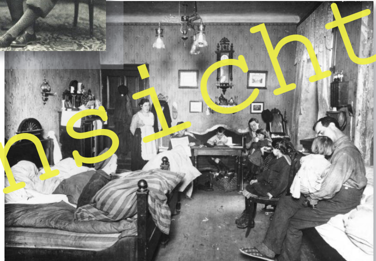
Eine Familie der Unterschicht zu Beginn des 20. Jahrhunderts

Nicola Perscheid, Theodor und Jacob Hilsdorf, August Sander: Der rheinland-pfälzische Beitrag zur Geschichte der Photographie. Katalog Landesmuseum Mainz 1989.