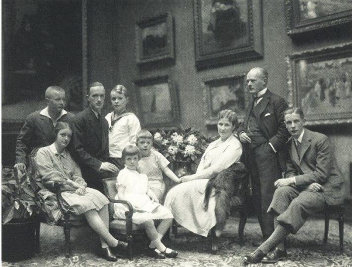
Die Unternehmerfamilie Krupp

Ende des 19. und Anfang des 20. Jahrhunderts gab es im Deutschen Kaiserreich große soziale Unterschiede, die im Zuge der Industrialisierung entstanden waren. Schau dir hierzu die beiden Bilder genau an.