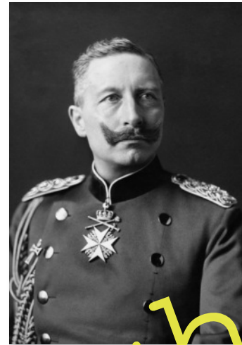
Kaiser Wilhelm II.

Die Schülerinnen und Schüler erarbeiten sich in einem Lernzirkel mithilfe von Texten, Quellen, Bildern und eines Rätsels die wichtigsten Aspekte der verschiedenen Gesellschaftsschichten des Deutschen Kaiserreiches.