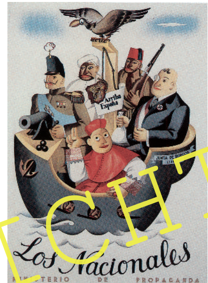
Auch Deutschland und Italien waren mit im Boot der Franco-Unterstützer (Plakat der Volksfront-Regierung, 1937).

Die Schülerinnen und Schüler untersuchen in dieser Einheit das berühmte Picasso-Gemälde „Guernica“, Positionen der Kriegsparteien, Deutschlands Rolle im spanischen Bürgerkrieg sowie Quellen aus dem Franquismus. Außerdem überlegen sie, warum es für die heutige Gesellschaft Spaniens wichtig ist, den Bürgerkrieg und die Franco-Herrschaft historisch aufzuarbeiten.