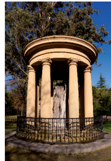
Diese Eiche in Guernica ist das Nationalsymbol der Basken.

Bei einem Besuch in Spanien bekannte sich 1997 der damalige Bundespräsident Roman Herzog offiziell zu Deutschlands Schuld an dem Angriff auf Guernica.