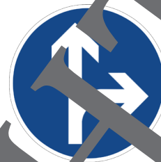
Bild: Meinungsfreiheit