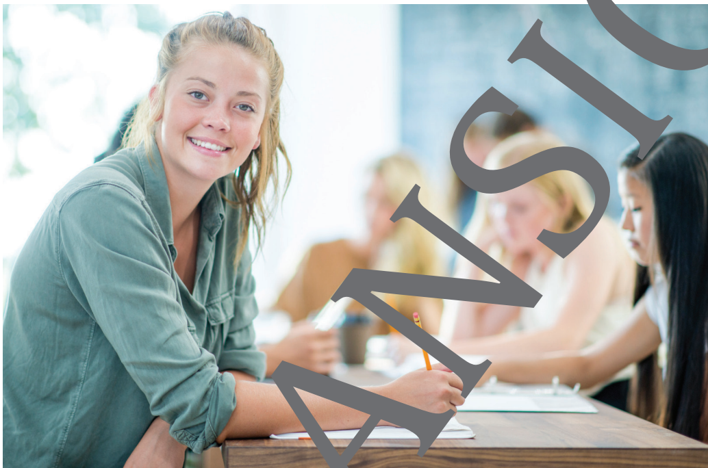
Illustration: Julia Lenzmann