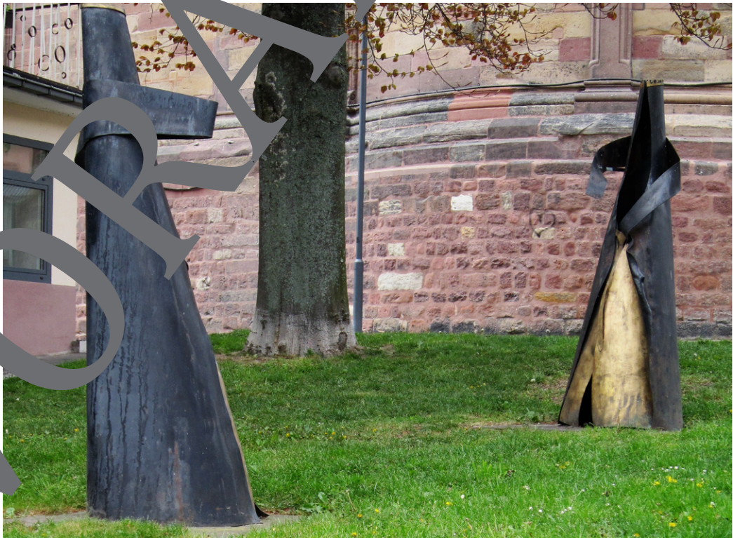
Streit der Königinnen von Jens Nettlich