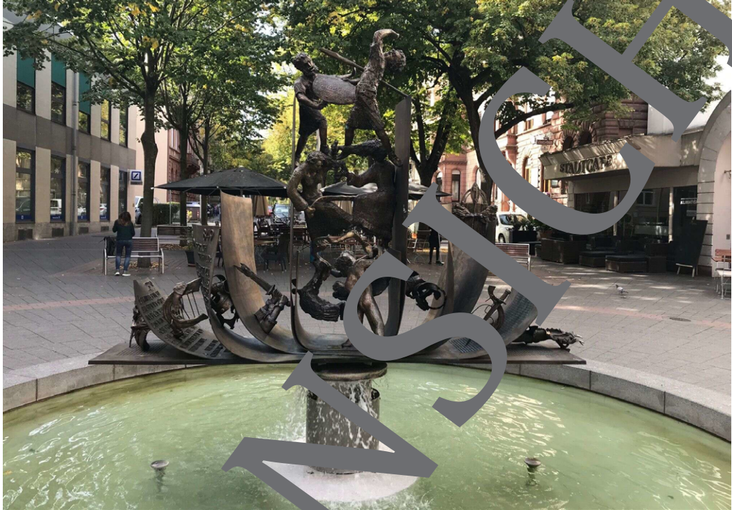
Nibelungenliedbrunnen von Gustav Nonnenmacher

Worms gilt als Nibelungenstadt, da dort viele Handlungen des ersten Teils des Nibelungenliedes spielen. Außerdem ist die Stadt die Heimat von Kriemhild und ihren drei Brüdern. In Worms befinden sich auch zwei Skulpturen, die das Nibelungenlied künstlerisch umsetzen.