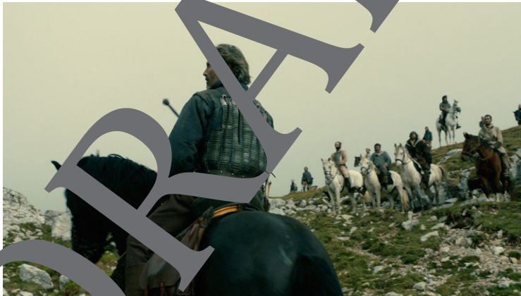
Szenenbilder aus „Michael Kohlhaas“ (Mads Mikkelsen).