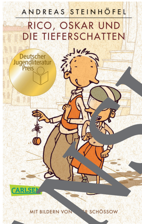
Rico und Oskar sind zwei außergewöhnliche Jungen