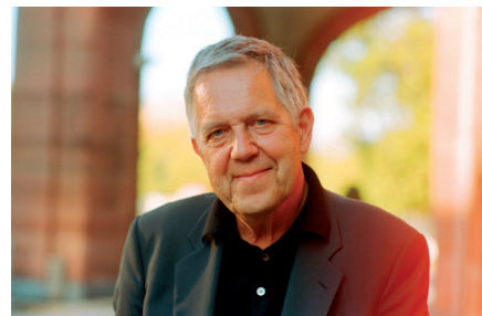
Robert Gernhardt im Jahr 2002

Robert Gernhardt war ein deutscher Maler, Karikaturist und Schauspieler. Er lebte von 1937 bis 2006 und ist vor allem für seine komischen Gedichte bekannt. Die Bücher „Körper in Cafés“ (1987), „Weiche Ziele“ (1994) und „Lichte Gedichte“ (1997) gelten als Glanzstücke seiner Dichtung. Gelingt es Gernhardt, die Leser mit seinen Gedichten zum Lachen zu bringen? Wie erzeugte er durch Sprache Komik? In den nächsten Stunden erfährst du mehr darüber!