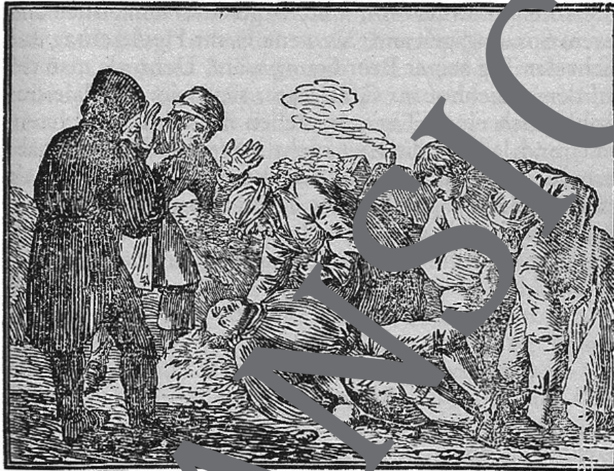
Titelkupfer der Kindergeschichte „Unerhofftes Wiedersehen“ – Ihre Schüler interpretieren die Symbole der Erzählung.