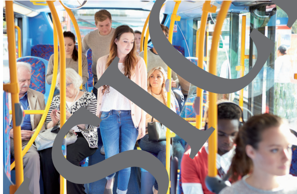
Obt sieht man morgens auf dem Weg zur Arbeit oder in die Schule immer wieder die gleichen Leute.

Erst, als sie einige Tage nicht im Bus saß und mich dies beunruhigte, erkannte ich die Notwendigkeit des allmorgendlichen Übels. Ich war erleichtert, als sie wieder erschien, ärgerte mich doppelt über sie, den Haarknoten, der ungewöhnlich und trotzdem lang-