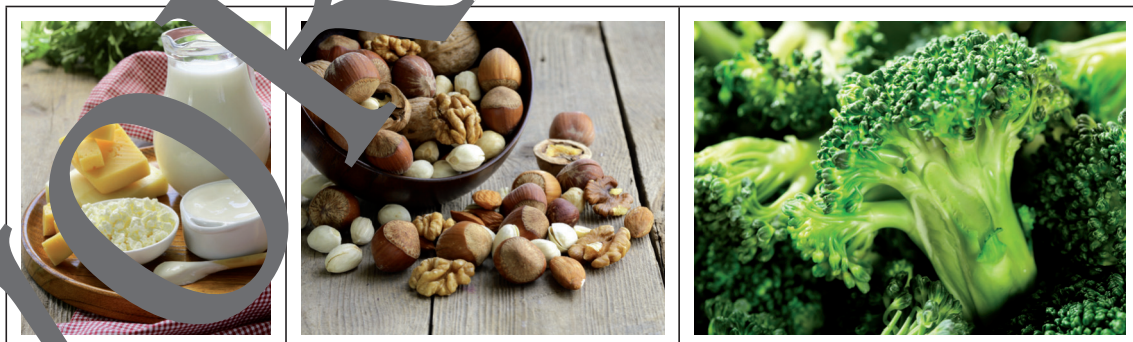
Calcium ist in einer Reihe von Nahrungsmitteln enthalten

Viel Calcium enthalten unter anderem Milch und Milchprodukte, grünes Gemüse, Käse, Eier sowie Nüsse. Auch Mineralwasser kann viel Calcium enthalten. Hier bestehen aber größere Schwankungen. Wenig Calcium steckt hingegen in Obst, Fleisch und Fisch.