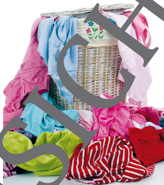
Wo kommt eigentlich die Kleidung her?

Was ziehe ich heute an? Täglich dieselbe Frage. Gute Kleidung soll dem Anlass angepasst sein, dem Wetter entsprechen und natürlich gut aussehen. Dabei sagt die Wahl viel über den Träger aus. Kulturkreis, geschichtliche Epoche, Religion und Beruf sind nur einige Aspekte, die man daran ablesen kann. Doch während die Auswahl vor 70 Jahren und mehr durch hohe Kosten beschränkt war, gibt es heute Shirts schon für 3 Euro. Kleidung verändert sich: der Stil, die Stoffe, die Herstellung, die Menge an Kleidung, die wir besitzen. Grund genug, dieses Thema einmal genauer zu betrachten. In dieser Einheit lernen Ihre Schüler die Geschichte der Bekleidung kennen, dabei nehmen sie unsere heutige Kleidung und deren Herstellung genauer unter die Lupe.