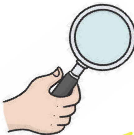
Dem Fehler auf der Spur

H ier sind die Schüler ihr eigener Lehrer. Sie schreiben allein oder mit Partner Diktate und werden dann mithilfe eines passgenauen Trainings angeleitet, ihre Rechtschreibung gezielt zu üben und nachhaltig zu verbessern. Dieser Beitrag liefert alles, was dafür notwendig ist: motivierende Texte und Diktatformen, einen individualisierbaren Trainingsplan sowie abwechslungsreiche Übungen und Spiele. Sie werden sehen: Mit diesem Rechtschreibtraining kommen Ihre Schüler jedem Fehler auf die Spur.