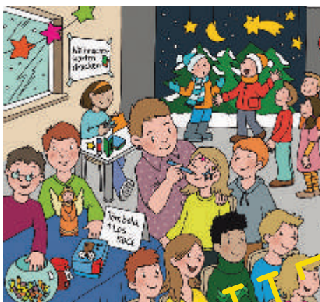
Auf der Weihnachtsfeier ist was los!

W ie viele Kinder waren auf der Weihnachtsfeier? War das Theater oder die Tombola beliebter? Und wie viele Waffeln wurden verkauft? – Solche Fragen regen Ihre Schüler in der vorliegenden Unterrichtseinheit dazu an, Statistiken rund um das Schulfest zu erstellen, indem sie Daten erheben, auswerten und in Diagrammen darstellen. Ein solches Arbeiten macht nicht nur Spaß, es wird auch dem Anspruch an zeitgemäße Sachaufgaben gerecht: die Behandlung von Situationen aus dem Alltag und die Betrachtung authentischer Sachrechenanlässe mit „mathematischen Augen“.