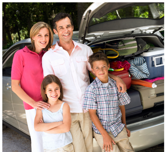
Bild 1 © picture alliance/Jochen Eckel. Bild 2 © Thinkstock/XiXinXing. Bild 3 © Thinkstock/FlairImages. Bild 4 © Thinkstock /photodisc.