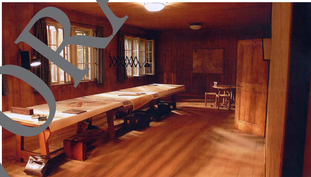
Bild zu finden unter: https://i1.wp.com/dresden-magazin.com/wp-content/uploads/2019/06/Exponat-4_Lagebaracke-Valkyrie-Innenansicht.jpg?resize=2048%2C1161&ssl=1 [zuletzt geprüft am 26.10.2022].