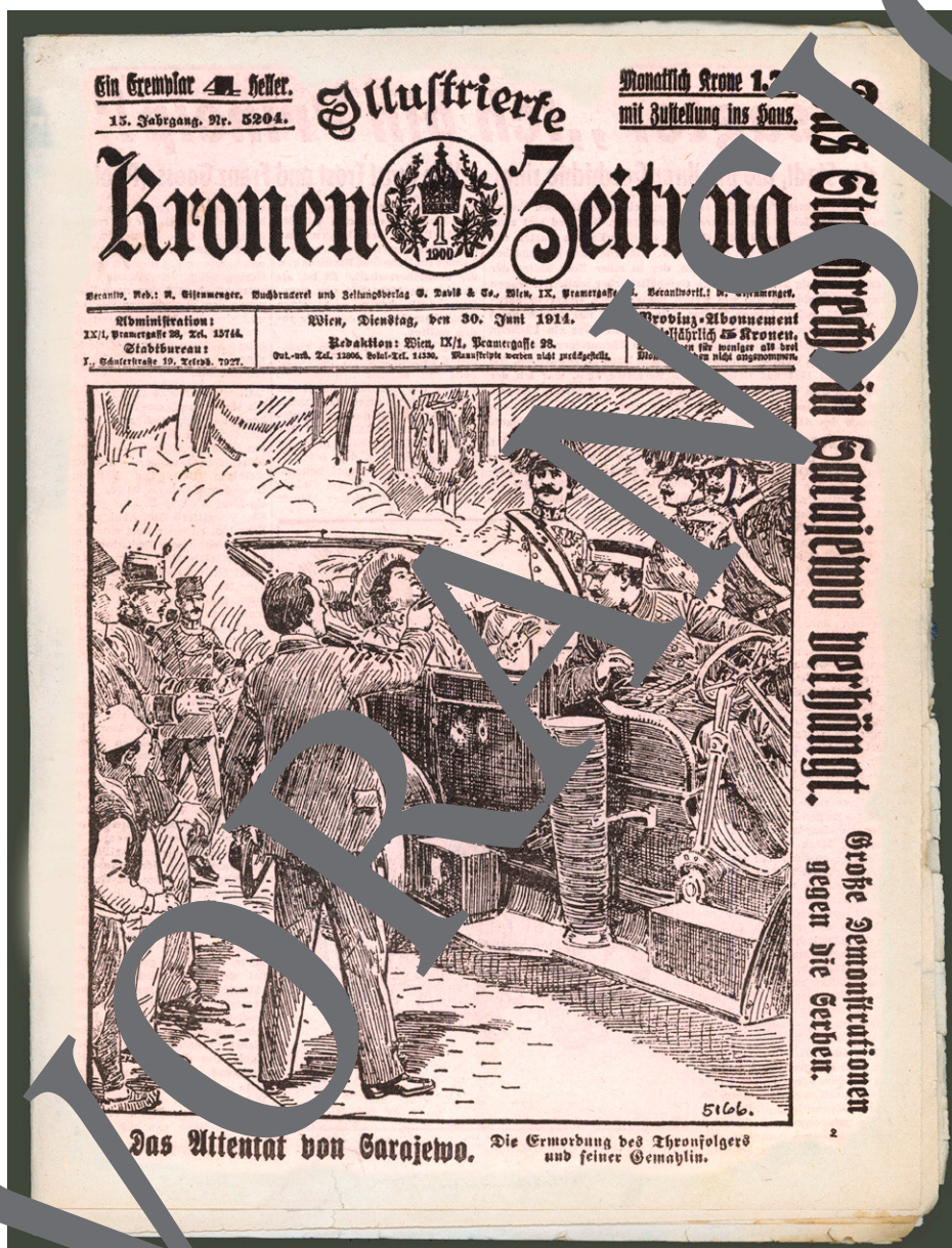
Titelseite: Illustrierte Kronen-Zeitung, Wien, 30. Juni 1914.