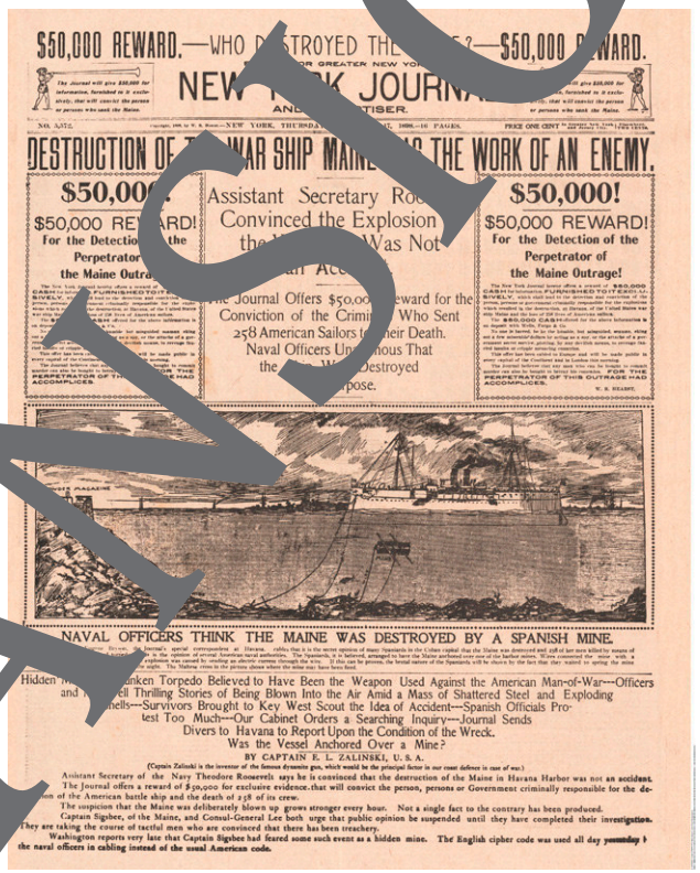
NEW YORK JOURNAL vom 17. Februar 1898. Das Kriegsschiff „Maine“ ankert im Hafen von Havanna. Eine als „MINE“ bezeichnete Höllenmaschine liegt unterhalb des Schiffes im

NEW YORK JOURNAL (Zeitung William R. Hearsts)