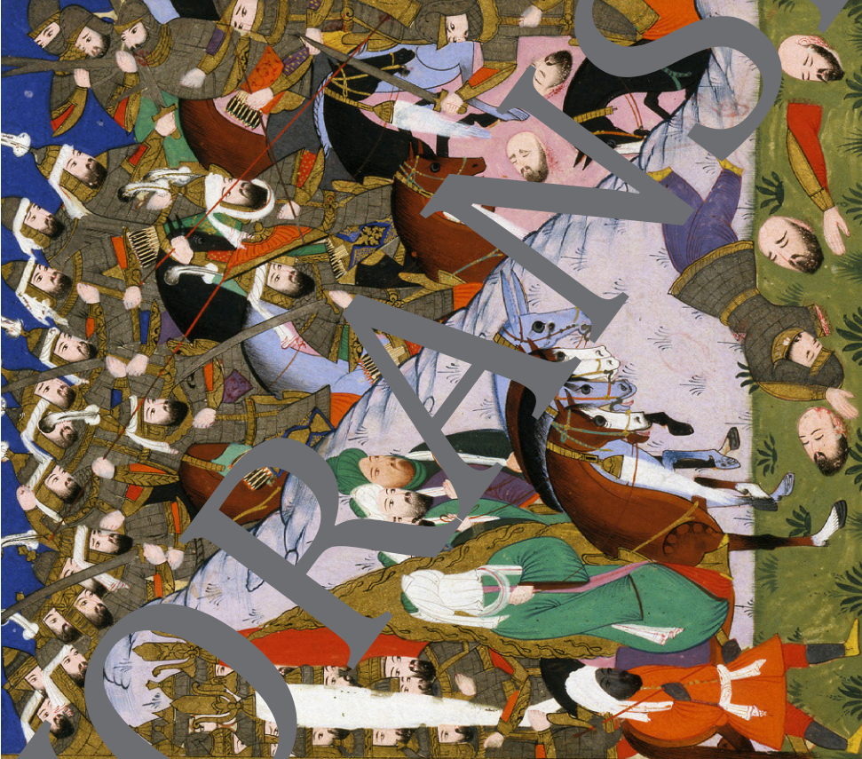
Mohammed in der Schlacht bei Uhud, türkische Buchmalerei aus dem 16. Jahrhundert