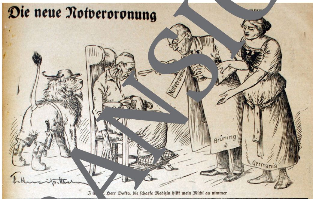
Karikatur von Emil Krieger, 1931

Anmerkung: Der Löwe links im Bild ist das Signet des Karikaturisten und für die Interpretation ohne Bedeutung. Der Text unten lautet „I moan, Herr Dokter, die scharfe Medizin hilft mein Vieh aa nimmer“.