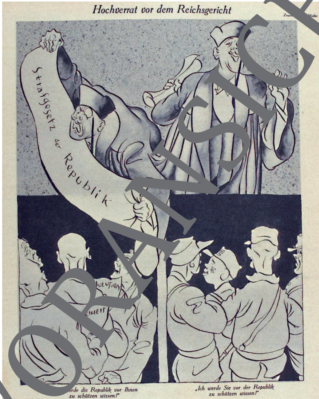
Karikatur von Gerhard Holler aus der Satirezeitschrift „Ulk“ vom 4. März 1927.

Von 1871 bis 1933 erschien beim Berliner Verleger Rudolf Mosse das illustrierte Wochenblatt für Humor und Satire mit dem Titel „Ulk“ – ein Akronym für die drei Ressorts „Sinn“, „Leichtsinn“ und „Kneipsinn“. In dieser Zeitschrift wurde im März 1927 die hier reproduzierte Karikatur veröffentlicht.