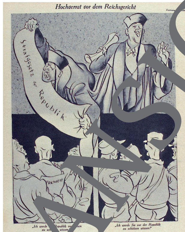
„Hochverrat vor dem Reichsgericht“ – Karikatur aus der Satirezeitschrift „Ulk“ (1927)

War die Rechtsprechung in der Weimarer Republik von Prinzipien der Rechtsstaatlichkeit und Unabhängigkeit verpflichtet? Welche Aussagen zur politischen Überzeugung der Richter lassen sich anhand von in der Weimarer Zeit gefällten Gerichtsurteilen gewinnen?