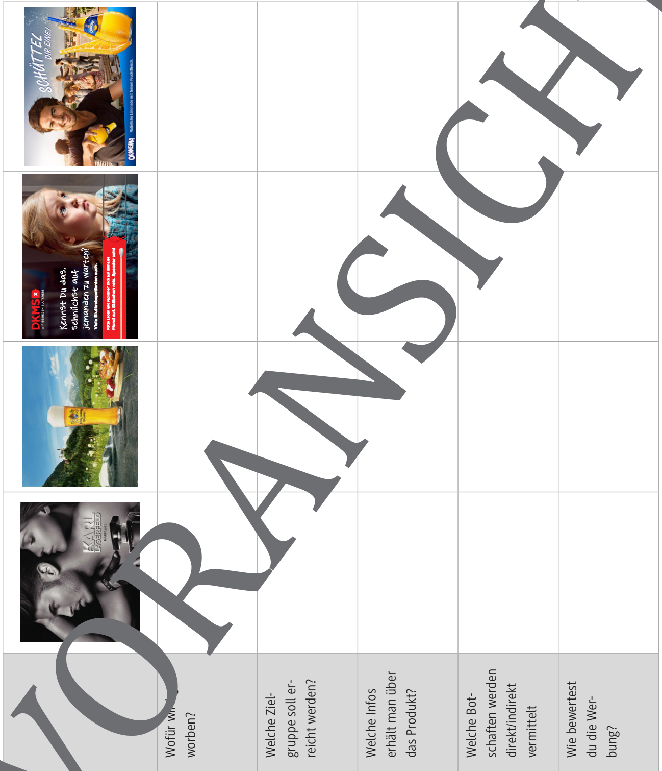
Bild 1: https://www.das-lix-prinzip.com/sex-sells-oder-sexismus-werbung-zwischen-kreativtaet-und-feminismus/#page-content

Bildet vier Gruppen und füllt für eine Werbung die Liste aus. Denkt auch an das AIDA-Modell.