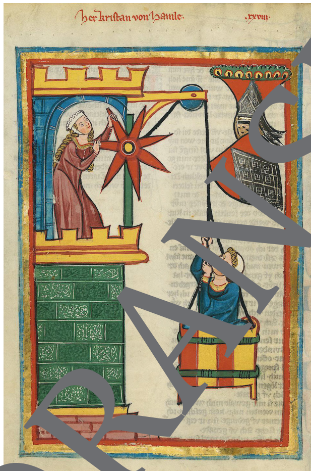
Aus der Grossen Heidelberger Liederhandschrift (Codex Manesse).