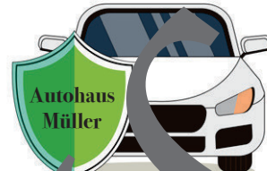
Autohaus Müller Mit uns fahren Sie gut!