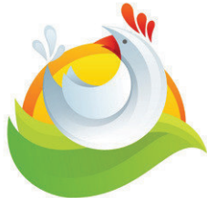
Biohof Bauer Landwirtschaft vom Feinsten