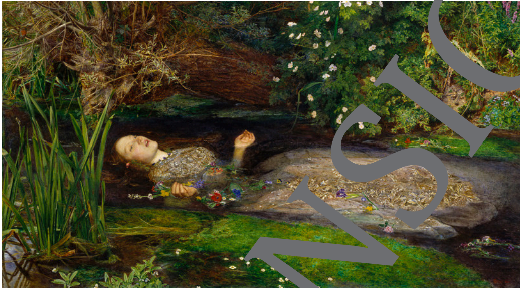
John Everett Millais (1829–1896): „Ophelia“ (1852) Ausschnitt.

Die Frauengestalt der Ophelia aus William Shakespeares „Hamlet“ hat Generationen von Dichtern und Komponisten immer wieder fasziniert und inspiriert. Sie wird hier zum Ausgangspunkt einer Unterrichtsreihe, die über die Beschäftigung mit Musik aus verschiedenen Jahrhunderten zur Gestaltung eigener Liedvertonungen hinführt.