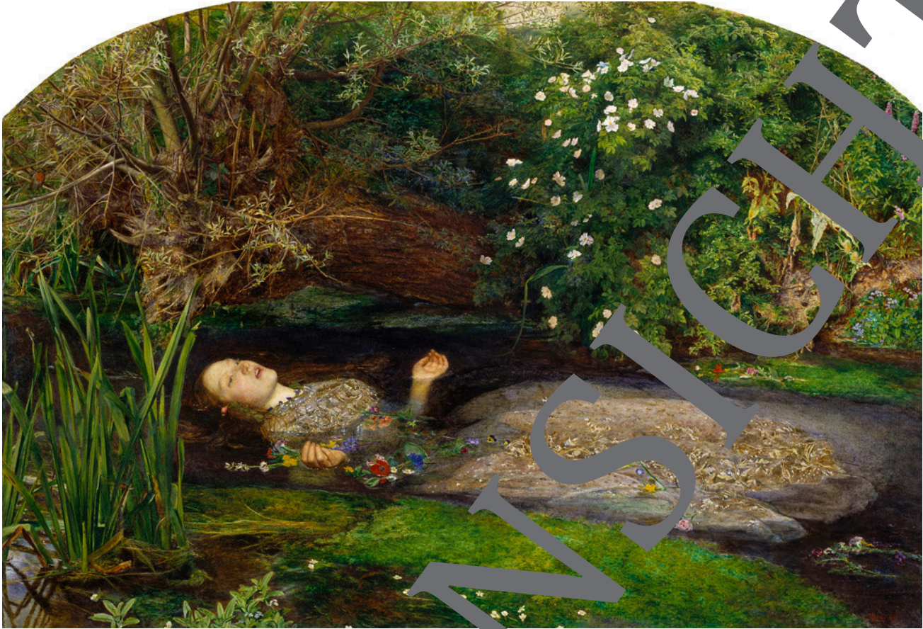
John Everett Millais (1829–1896): „Ophelia“ (1852).