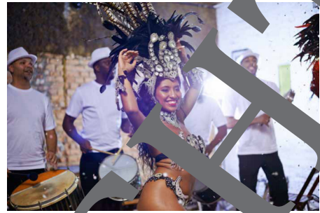
Sambatänzerin mit Schlagzeugspielern

Die Entstehung der lateinamerikanischen Tänze verdankt sich dem Einfluss afrikanischer Sklaven auf die mittel- und südamerikanische Gesellschaft. Die Tänze sind typische Akkulturationsphänomene. sehr schnell verbreiteten sie sich auch in Nordamerika und später in Europa. Zu beobachten ist ein Einfluss der lateinamerikanischen Rhythmen auf den Jazz.