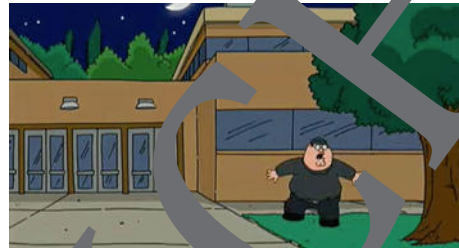
Szenenbilder: Vorspann Pixar Studios (links) Family Guy (rechts)