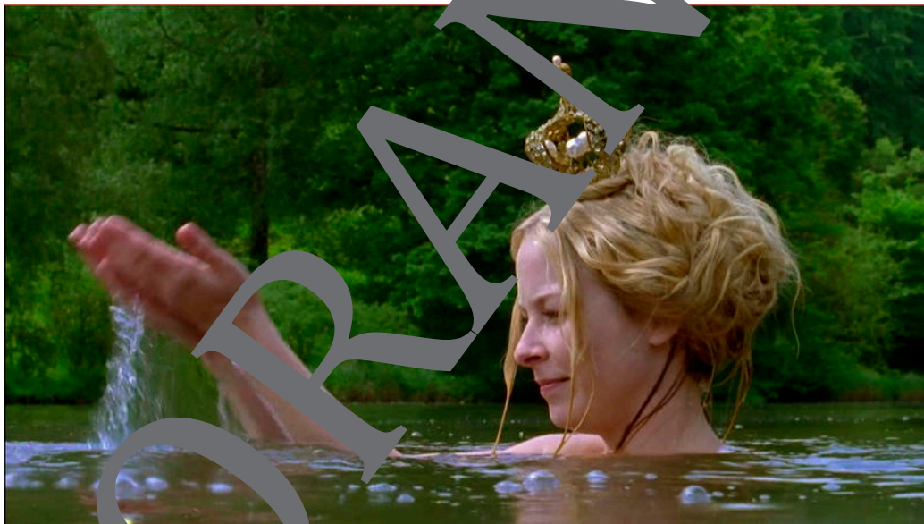
Szenenbild aus König Drosselbart (2008)