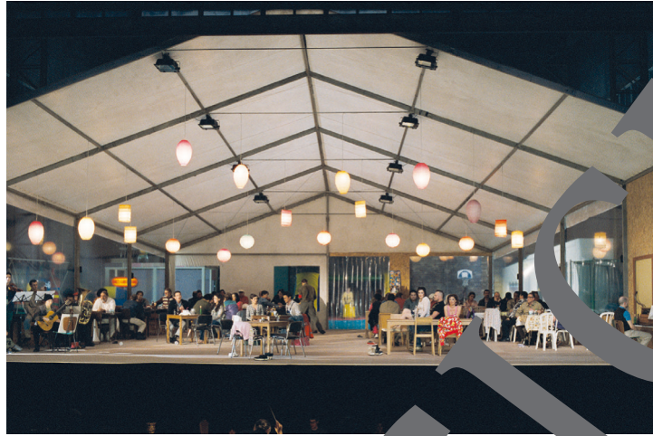
Wirtshausszene aus „Wozzeck“