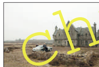
James Bond and “Skyfall”