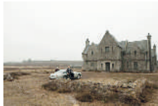
Screenshot aus „Skyfall“