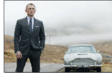
James Bond vor seinem Aston Martin

1953 kreierte Ian Fleming (ein berühmter britischer Romanbuchautor) den fiktionalen Charakter von James Bond. Dieser ist ein Agent beim britischen Geheimdienst, dem sogenannten MI6. Fleming schrieb 12 Romane und zwei Kurzgeschichtensammlungen mit James Bond als zentraler Figur. Bond ist auch durch seine Code-Zahl 007 bekannt. Fleming beschrieb Bond als „[...] gut aussehend. Das schwarze Haar über die rechte Augenbraue fallend. Aber da gab es einen grausamen Zug um den Mund und die Augen waren kalt.“ James Bond liebt schnelle Autos, ungewöhnliche Waffen und das Glücksspiel. Sein Lieblingsauto ist der silbergraue Aston Martin DB5, welcher zuerst im Film Goldfinger zu sehen war; dieses Auto fährt er auch in „Thunderball“, „Golden Eye“, „Tomorrow Never Dies“, „Casino Royal“ und „Skyfall“. Der Geheimagent Bond trinkt seinen Martini „geschüttelt, nicht gerührt“.