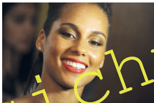
Imago / Future Image