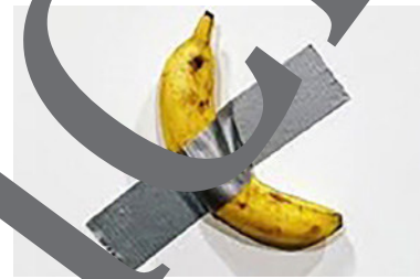
Maurizio Cattelan's « Comedian ».

Texte: Redaktion HYPERLINK „ http://www.spiegel.de “ www.spiegel.de/brs:Epstein-Meme-ersetzt-120.000-Dollar-Banane . 10. 12. 2019, https://www.spiegel.de/kultur/gesellschaft/120-000-dollar-banane-epstein-meme-auf-art-basel-aufgetaucht-a-1300521.html [Letzter Abruf am 24. 08. 2023]