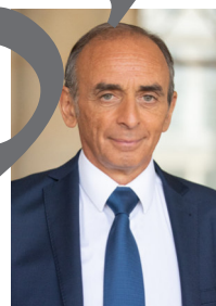
Wikimedia Commons (domain publique)