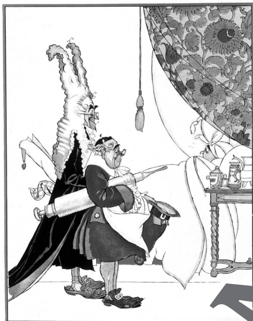
Administration d'un remède, scène du "Malade imaginaire" de Molière.

Bringen Sie Ihre Schüler/innen mit Molières „Eingebildetem Kranken“! Die Unterrichtsreihe macht Ihre Schüler exemplarisch mit universell einsetzbaren Strategien der Drameninterpretation vertraut.