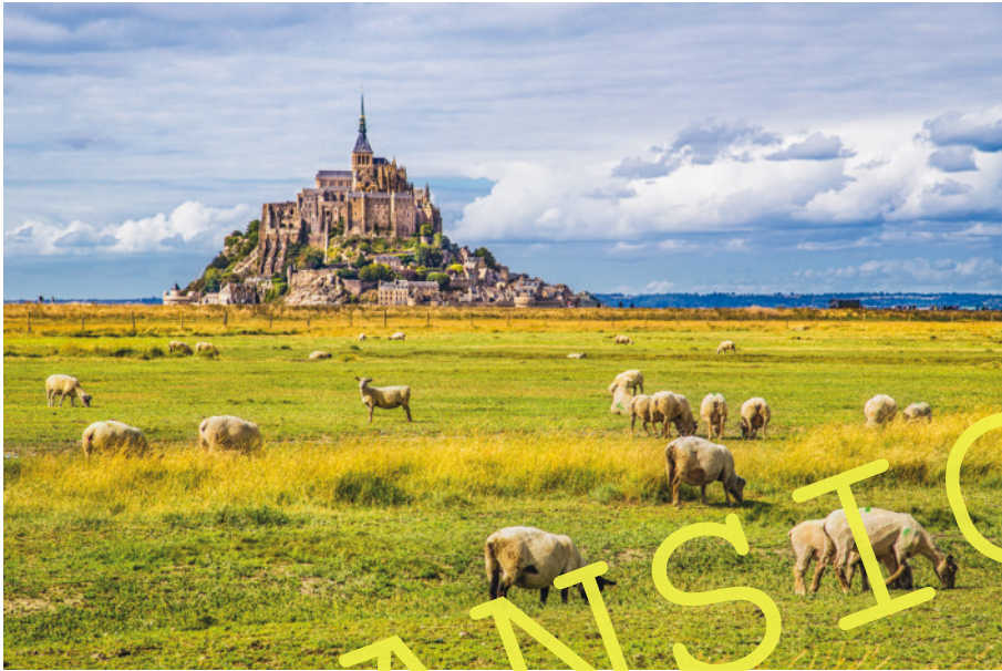
Le Mont-Saint-Michel, un endroit exceptionnel.