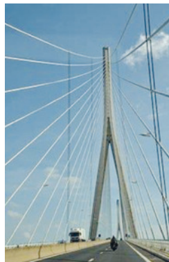
Le Pont de Normandie