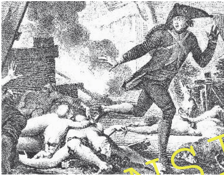
Illustration: Jean-Michel Moreau (le Jeune).

Der gutgläubige Optimist Candide erlebt auf seiner abenteuerlichen Reise eine Katastrophe nach der anderen. Werden seine Erfahrungen seine Einstellung ändern?