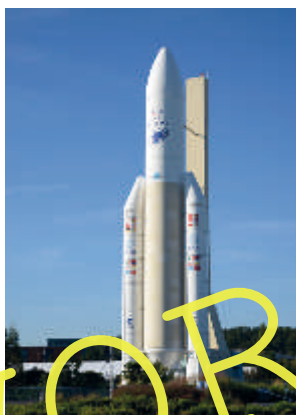
La fusée Ariane

10 de l'aéronautique et de l'aérospatiale.