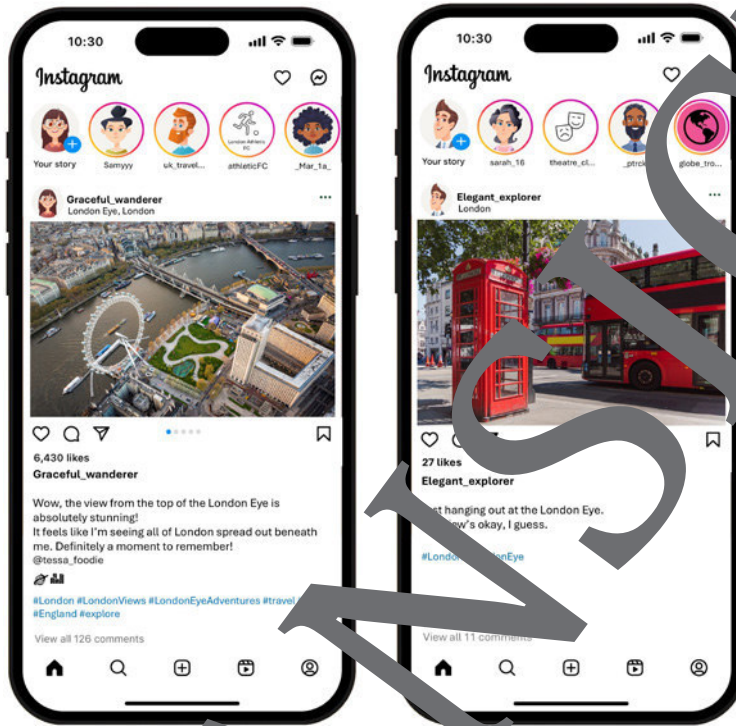
© Photos: Photodisc/Getty Images/iStock/Getty Images Plus and DimTik/iStock/Getty Images Plus; template: icons gate - stock.adobe.com created by Svenja Draudt, text by Eileen Friede