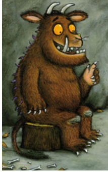
© Axel Scheffler/ PanMacMillan Children's Books

The Big Bad Mouse has got a terribly long _____ and this creature _____. This creature _____, but the Big Bad Mouse has got whiskers tougher than wire. The _____ of the Big Bad Mouse are like pools of _____ fire. But this animal _____.