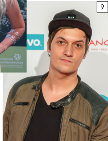
Photos 1–9: © Von Toglenn– Eigenes Werk, CC BY-SA 4.0, © By Ilona Higgins, CC BY-SA 2.0, © By Anthony Quintano, CC BY 2.0, © Von Steindy (talk) – Eigenes Werk, CC BY-SA 3.0, © By CharlieTPhotographic, CC BY 2.0, © Von Raimond Spekking, CC BY-SA 4.0, © Von 9EkieraM1 – Eigenes Werk, CC BY-SA 3.0, © Von Toglenn – Eigenes Werk, CC BY-SA 4.0, © Von Raimond Spekking, CC BY-SA 4.0