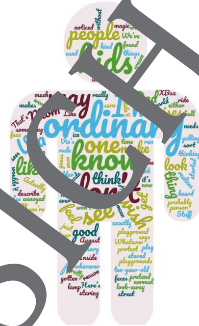
Word cloud: Dirk Beyer