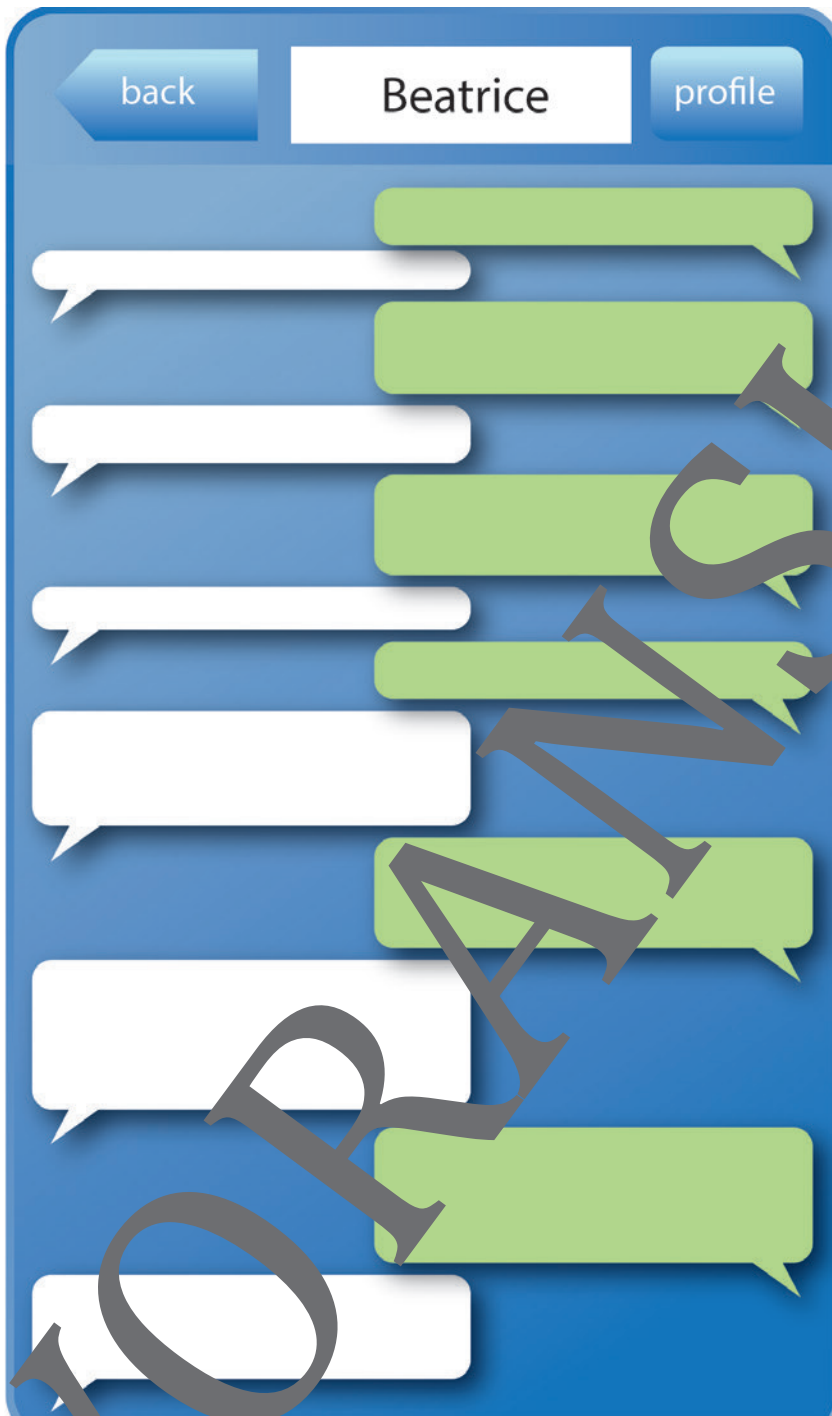
Illustration: Julia Lenzmann

Shakespearean English seems just too exhausting? Well, here's your chance: Put Shakespeare's words into a modern text message conversation!