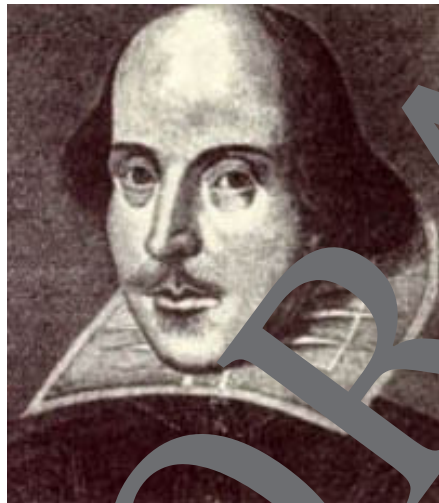
Portrait of William Shakespeare

In your imagination – what would Shakespeare look like today?