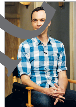
Actor Jim Parsons

Groß, schlaksig und unfähig, Sarkasmus zu verstehen, in The Big Bang Theory spielt Jim Parsons einen völlig überzeichneten Nerd [...]. Bereits seit 2007 verkörpert er den brillanten Physiker Sheldon Lee Cooper und erhielt dafür viel Ruhm und Ehre sowie zahlreiche Auszeichnungen. Dennoch bleibt es dem amerikanischen Schauspieler wichtig, nicht auf die Rolle des lustigen Außenseiters reduziert zu werden.