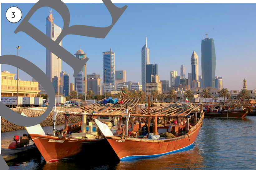
Traditionelle Fischerboote vor der Skyline von Kuwait-City