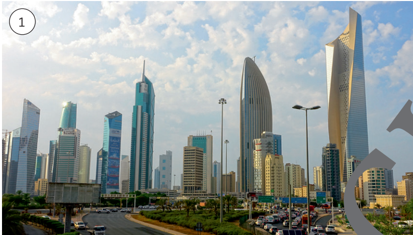
Skyline von Kuwait-City