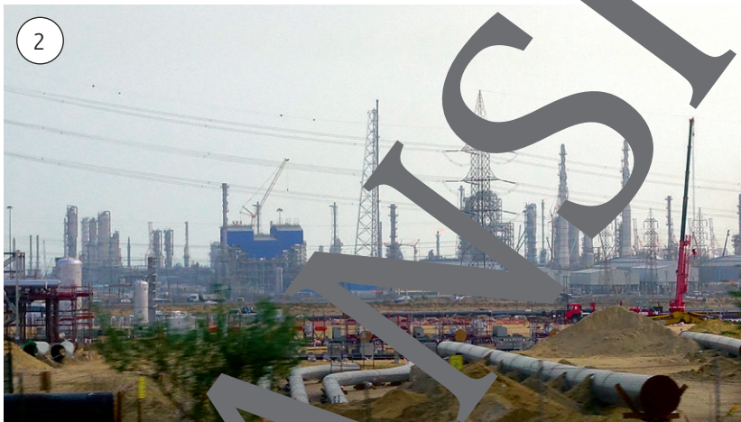
Erdölindustrie in der Wüste