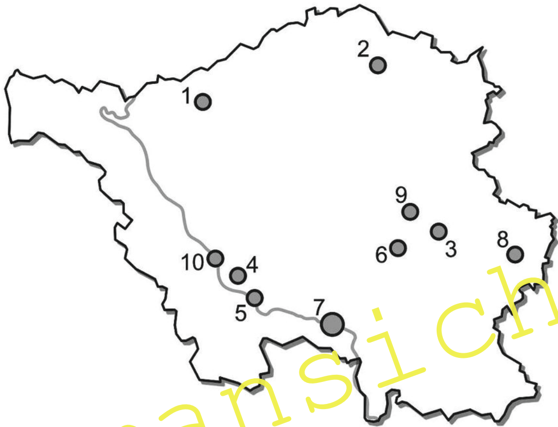
Umrisskarte des Saarlandes