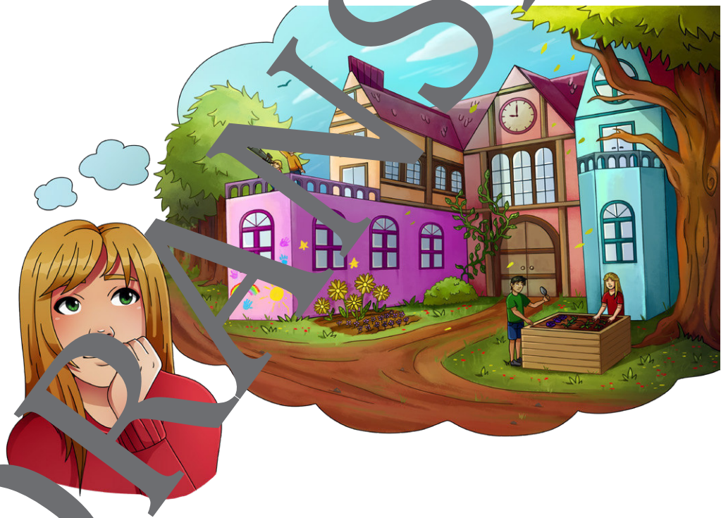
Zeichnung: Katharina Friedrich