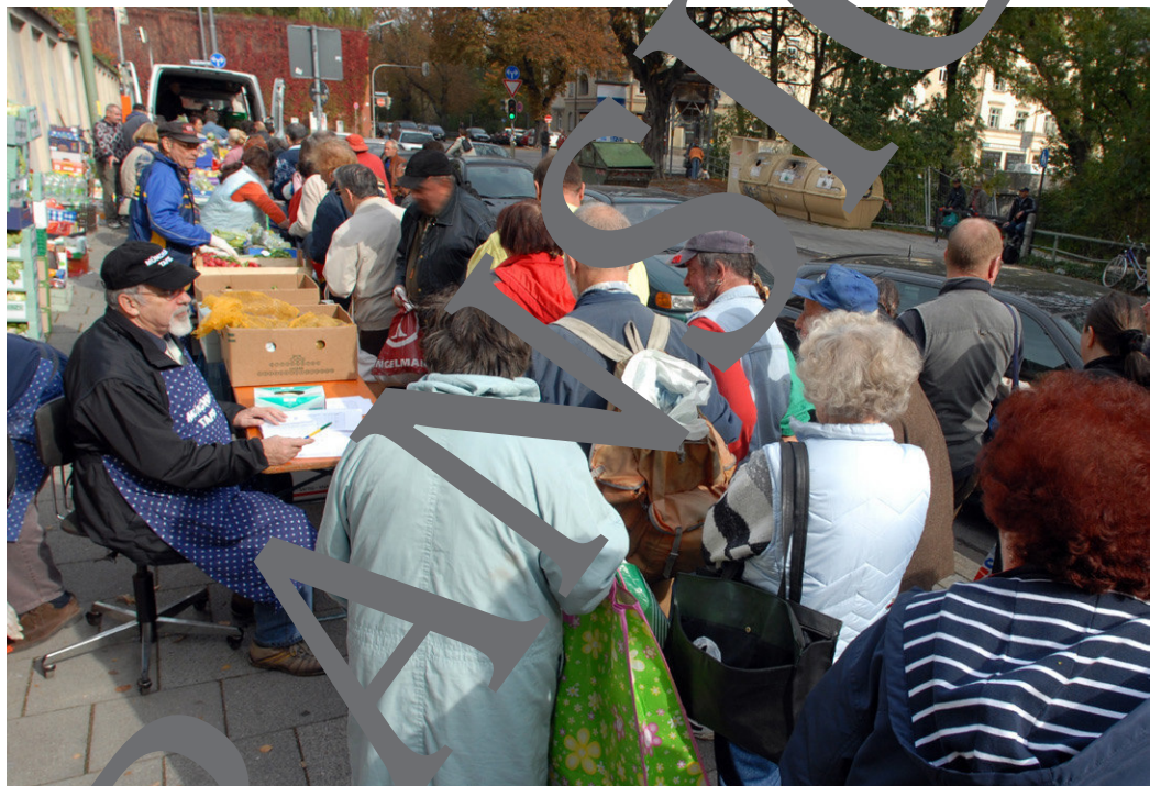
Menschen warten in München auf die Öffnung der Tafel.