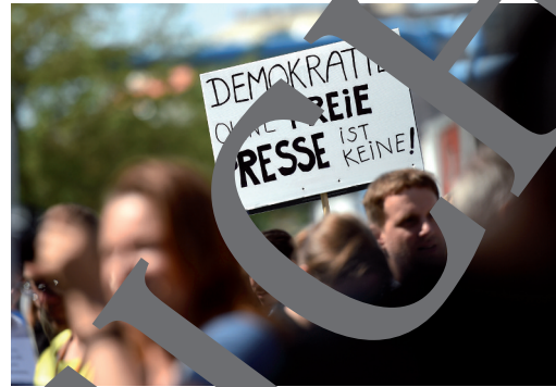
Demonstranten fordern Pressefreiheit

Das Wort „Presse“ leitet sich von der Druckerpresse ab, mit der früher Texte vervielfältigt wurden. Bis heute wird der Begriff verwendet, um Journalisten zu bezeichnen, auch wenn sie ihre Beiträge über Radio, Fernsehen oder Internet veröffentlichen. Pressefreiheit bedeutet, dass Journalisten ihre Meinung frei äußern können, ohne bei ihrer Arbeit behindert oder zensiert zu werden (in politischen Zusammenhängen heißt „Zensur“, dass bestimmte Äußerungen vor oder nach Veröffentlichung staatlich verboten werden).