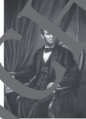
Abraham Lincoln, 16. Präsident der Vereinigten Staaten von Amerika.

Das Wort Demokratie stammt aus dem Griechischen und bedeutet Herrschaft des Volkes. Abraham Lincoln, der 16. Präsident der Vereinigten Staaten von Amerika, fand im Jahr 1863 sehr passende Worte, um Demokratie zu beschreiben. Er charakterisierte Demokratie als „die Regierung des Volkes, durch das Volk und für das Volk“.